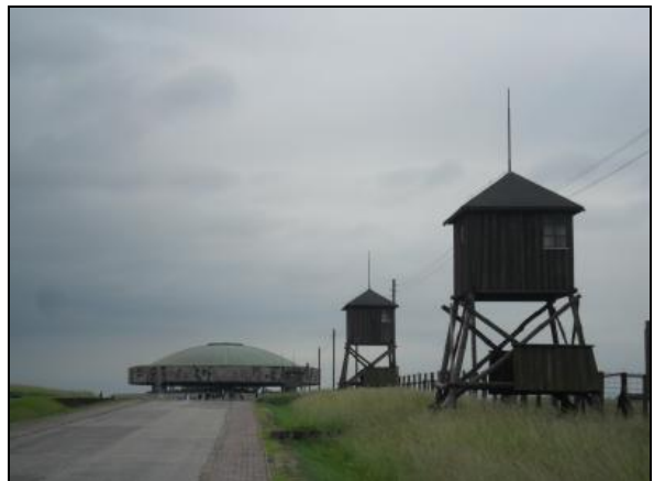
Fot. 4. Majdanek. Photo 4. Museum of former german nazi concentration camp in Lublin.