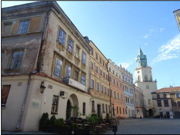
Fot. 1. Stare Miasto w Lublinie (Rynek). Photo 1. Old Town Market in Lublin.