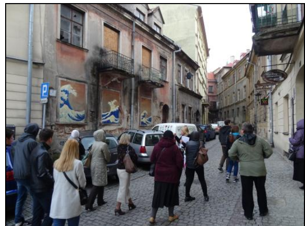
Fot. 12. Spacer po filmowym Lublinie. Photo 12. A stroll through film places in Lublin.