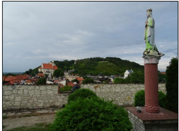
Fot. 6. Kazimierz Dolny (Widok sprzed Kośc. OO. Franciszkanów). Photo 6. The view from the front of The Franciscan Church in Kazimierz Dolny.