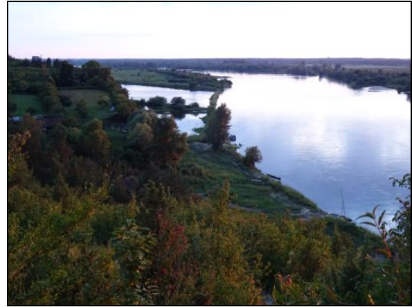
Fot. 8. Wisła w okolicach Kazimierza Dolnego (Albrechtówka). Photo 8. Vistula River near Kazimierz Dolny (Albrechtówka).