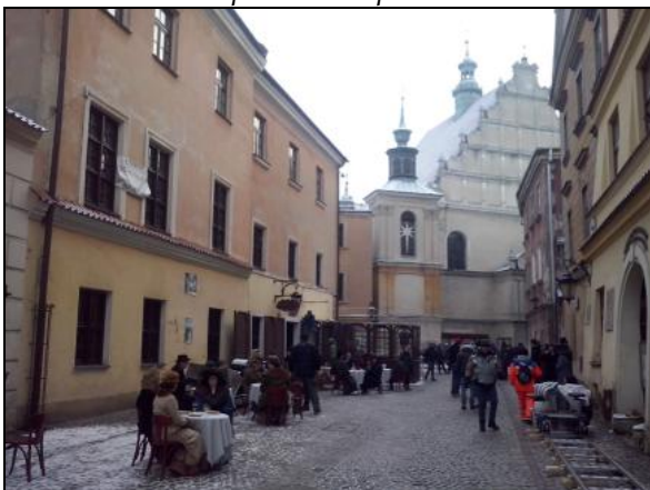
Fot. 11. Realizacja filmu „Panie Dulskie” na ul. Złotej w Lublinie. Photo 11. Production of the film “Panie Dulskie”, Złota Street in Lublin.