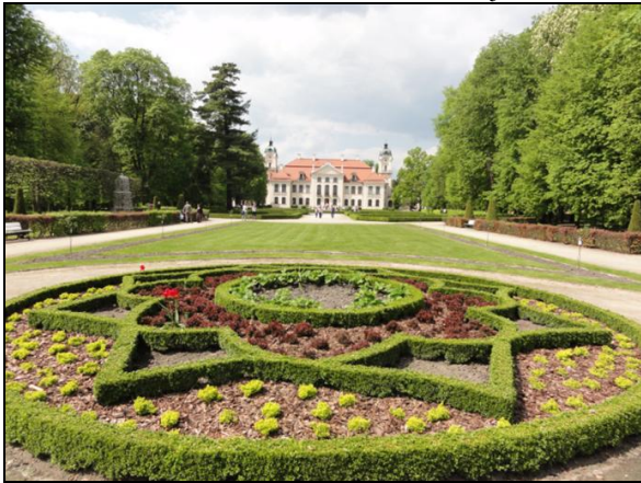
Fot. 9. Kozłówka. Photo 9. The palace and park in Kozłówka.