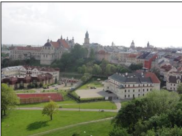
Fot. 3. Stare Miasto w Lublinie (Widok z Baszty Zamkowej). Photo 3. Old Town in Lublin (View from Castle Tower).