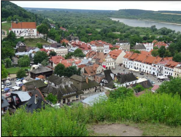
Fot. 7. Kazimierz Dolny (Widok z Góry Trzech Krzyży). Photo 7. The view from Hill of Three Crosses in Kazimierz Dolny.