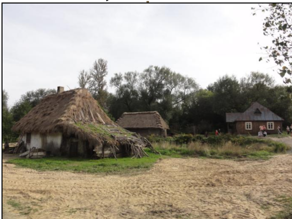
Fot. 5. Muzeum Wsi Lubelskiej. Photo 5. The Open Air Village Museum in Lublin.