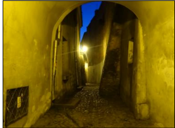
Fot. 2. Stare Miasto w Lublinie (ul. Ku Farze). Photo 2. Old Town in Lublin (Towards Parish Church Street).