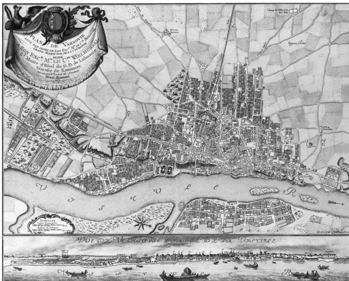
Ryc. 2. Plan i panorama Warszawy w 1772 r. w skali ok. 1:17500.