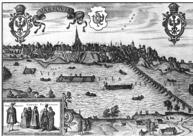
Ryc. 1. „Przód miasta” – widok z za rzeki. Varsovia (widok z Pragi). Źródło: Atlas Bran G., Hogenberg F. Civitates orbis terrarium... vol. 6, Colonia, 1618.